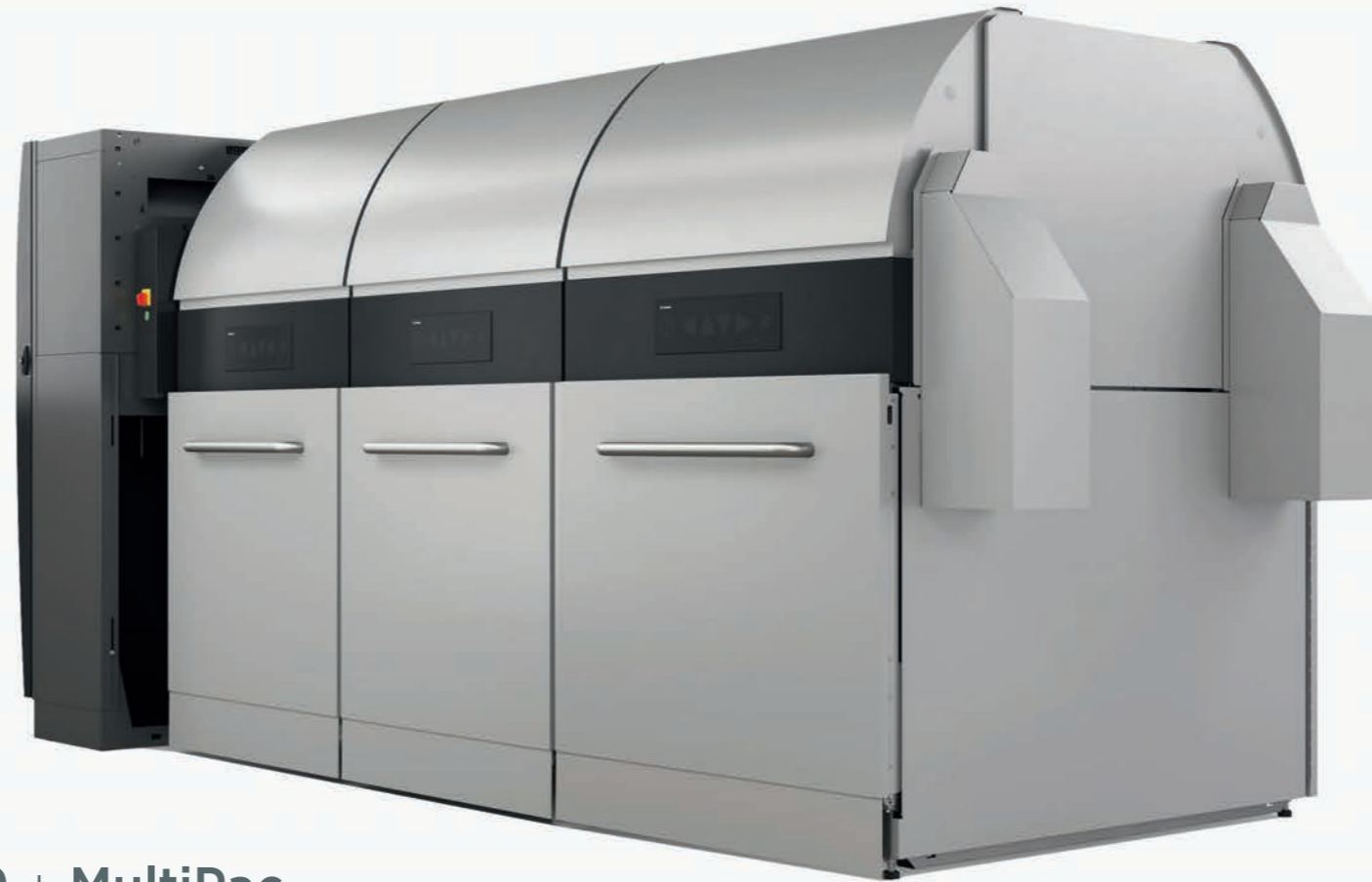
TOMRA T9 + MultiPac

Jokainen T9 + MultiPac laitteisto suunnitellaan vastaamaan asiakkaiden ja myymälän yksilöllisiä tarpeita. Puristimien ja säiliöiden määrä valittavissa palautusmäärien ja pakkausjakauman mukaan. Laitteiston kompakti rakenne vähentää myös tilantarvetta.